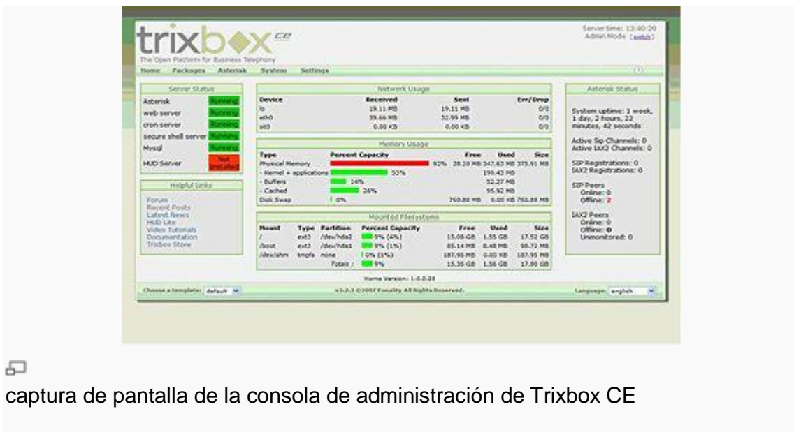
captura de pantalla de la consola de administración de Trixbbox CE

Comenzó en el año 2004 como un proyecto popular IP-PBX denominado Asterisk@Home. Desde ese momento se convirtió en la distribución más popular de con más de 65.000 descargas por mes. Dicha versión se caracteriza por dos pilares importantes; su flexibilidad para satisfacer las necesidades de los clientes, y sobre todo, por ser gratuita.